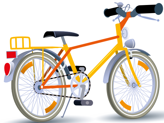
Fiets 4: geen reflector in pedaal.